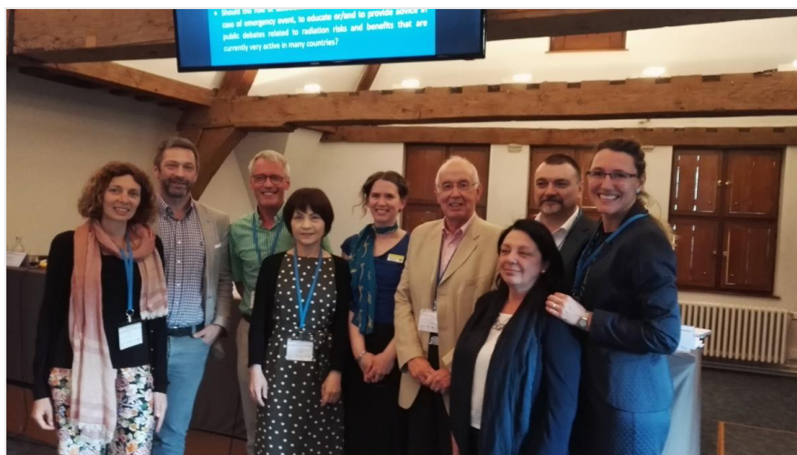
Members of BVS-ABR with representatives of international radiation protection associations at the workshop in Antwerp